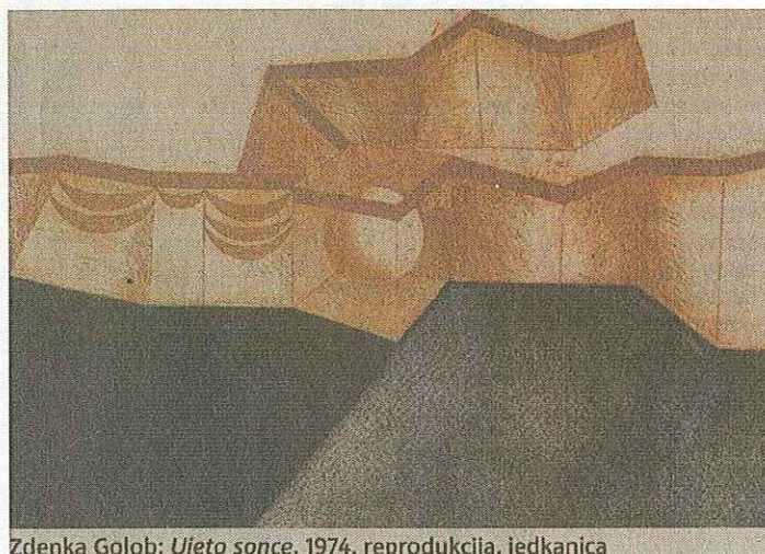
Zdenka Golob: Ujeto sonce , 1974, reprodukcija, jedkanica