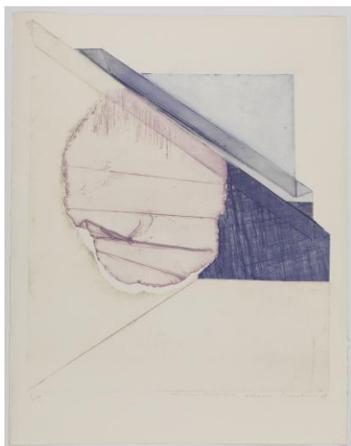
(ni naslova), 1979, jedkanica, zbirka MGLC