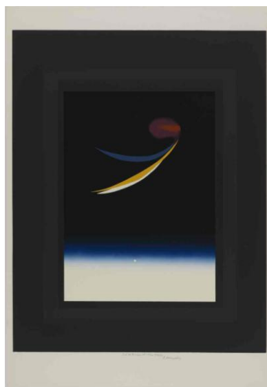
Magične dimenzije CXXXII, 1971/84, sitotisk.

S tem opusom je Riko Debenjak svoj grafični eksperiment pripeljal do konca, njegova eksperimentalna grafika pa se je za vselej zapisala v slovensko umetnostno zgodovino.