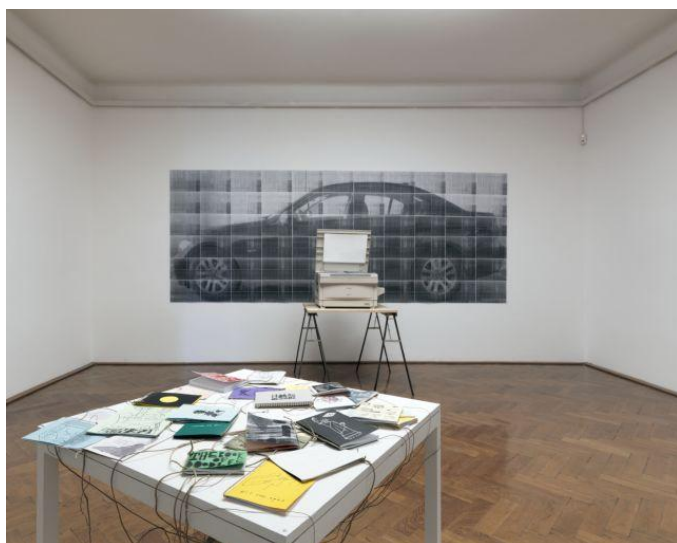
Utrinek z razstave.

Ob nastopu sodobnih informacijskih tehnologij so fanzini doživeli temeljito preobrazbo in so danes predvsem medij večinoma mlajših ustvarjalcev. Od politično angažiranega fanzina so prešli k veliko bolj individualiziranemu umetniškemu zinu (artzinu).