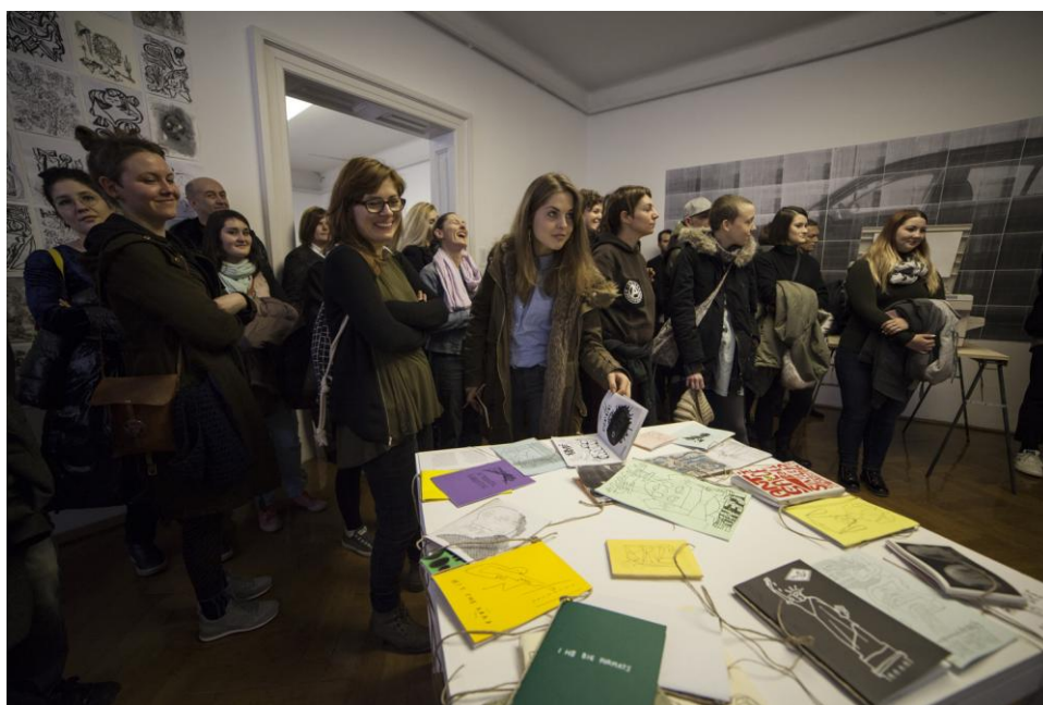
Utrinek z razstave.