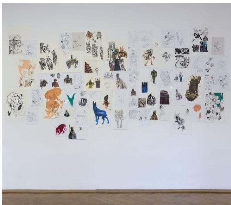
Utrinek z razstave.